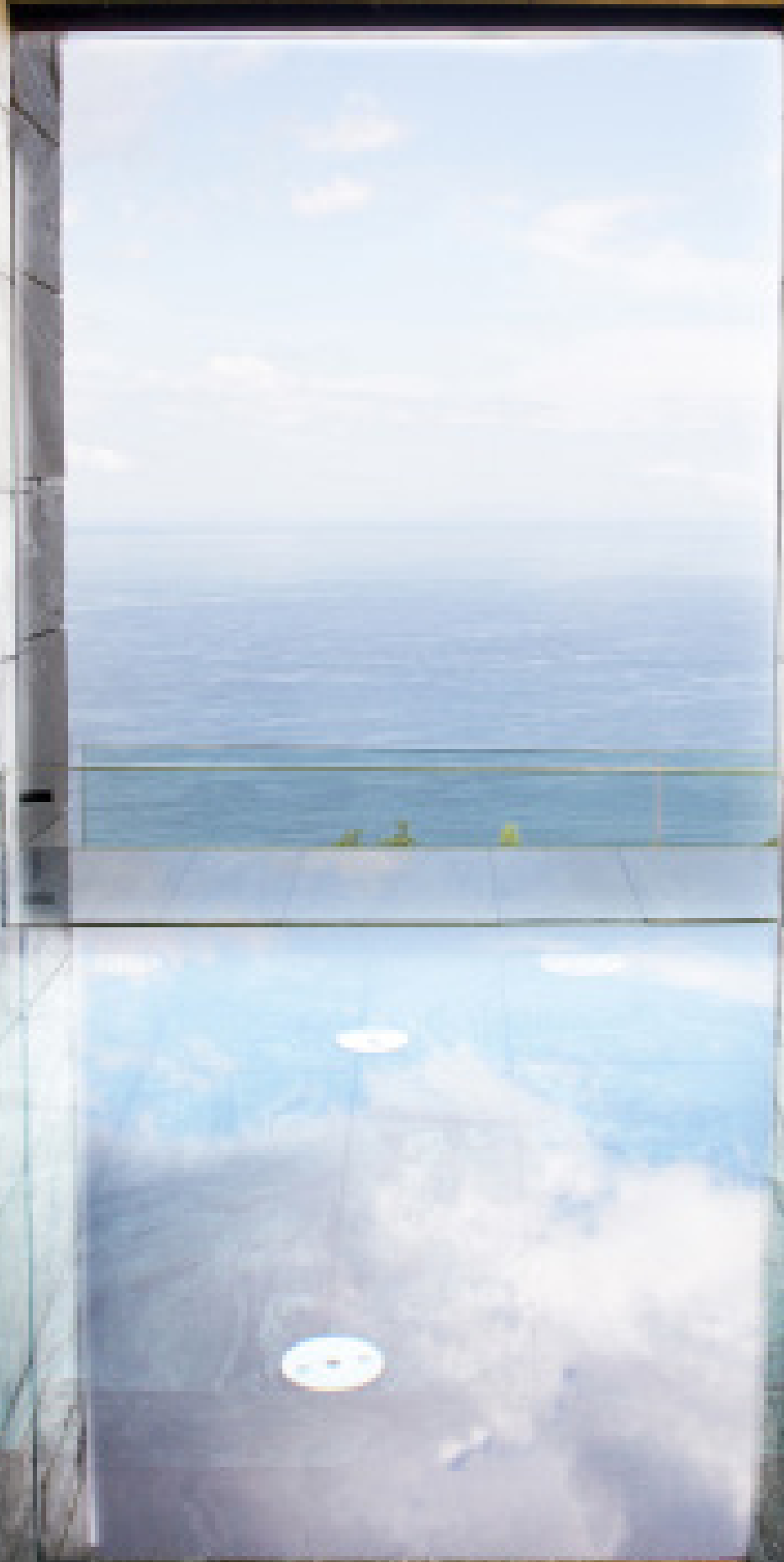
Vistas al Cantábrico desde el spa del magnífico hotel Akelarre Relais & Châteaux.